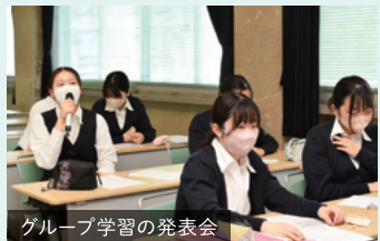
グループ学習の発表会